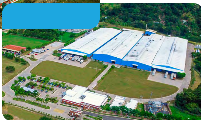
Pettenati Centro América - El Salvador