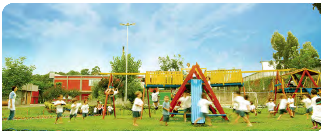
Imagem: Escola da Tia Fran - a frente crianças uniformizadas e descalças, correndo e brincando em um parque sob a grama, com escorregador, balanço e outros equipamentos de lazer, uma professora observa as crianças, ao fundo a escola, árvores e o céu azul.

Uma equipe de profissionais de pedagogia, psicopedagogia, fisioterapia, pediatria, odontologia, enfermagem e nutrição contribui com suas habilidades para cuidar e educar, visando a formação integral dos alunos.