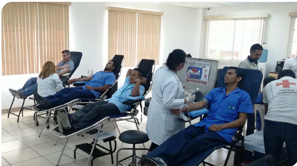
Imagem: a frente profissionais da Pettenati acomodados em macas enquanto fazem a doação de sangue acompanhados por profissionais da saúde. Atrás, homem veste camisa com escrita "Cruz Roja Salvadoreña". O ambiente é claro, iluminado e com janelas.

Em parceria com a Cruz Vermelha Salvadoreña, foi realizada a criação de um Banco de Sangue Empresarial, que procura estimular a doação voluntária e altruísta dos nossos profissionais. Incentivamos para que participem de doações de sangue nas instalações da Pettenati e esperamos com essa iniciativa apoiar em tempo hábil algum profissional ou familiar que possa necessitar com urgência.