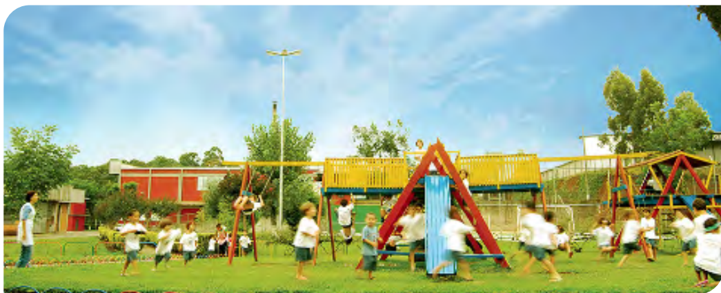
Audio descripción: Escuela de la Tía Fran - al frente niños uniformizados y descalzos, corriendo y jugando en un parque sobre el césped, con tobogán, balancín y otros equipamientos de diversión, una profesora observa los niños, al fondo la escuela, árboles y el cielo azul.

Un equipo de profesionales de pedagogía, psicopedagogía, fisioterapia, pediatría, odontología, enfermería y nutrición contribuye con sus habilidades para cuidar y educar, privilegiando la formación integral de los alumnos.