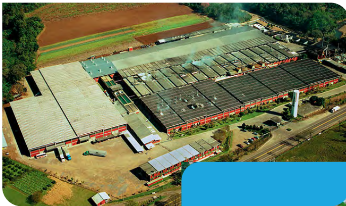
Pettenati Brasil - Fábrica de Tejido

Desde el inicio de sus actividades en 1964, Pettenati S.A. Industria Textil conquistó el mercado nacional e internacional, equiparando sus productos a los de fabricantes más calificados del mundo. La producción y la distribución de Pettenati cuentan con el apoyo primoroso de más de dos mil profesionales, instalados en tres unidades industriales.